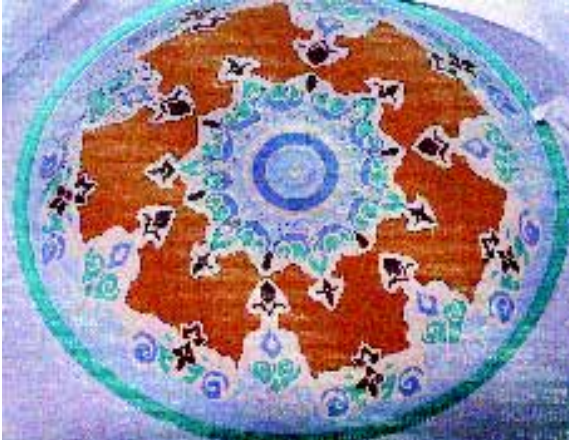
Tarihi Başoturak camisinden bir tavan detayı

Herhangi bir pazarlığa gerek bile duyulmaksızın Osmanlı sultanının bir lütfu olarak değerlendirilen kapitülasyonların ilki 1535'te Kanuni Sultan Süleyman tarafından, Fransız Kralı I. François'ya verilmişti. 1569'da II. Selim ve IX Charles, 1597'de III Mehmet ile IV Henry arasında imzalanan yeni metinlerle, Batı Anadolu'da Fatih zamanından beri ticari anlamda güçlü varlıklarını koruyan Venedikliler'in yanına Fransızlar da katılmıştı.