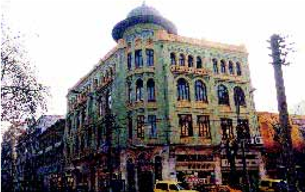
Cumhuriyet'in ilk yıllarından kalan bir bina

Bizans egemenliğinin sona erip, daha çok ticarete dayalı Ceneviz egemenliğinin hakim olduğu dönemler neredeyse iki yüzyıl sürdü. Türkler kenti, 11. yüzyılın