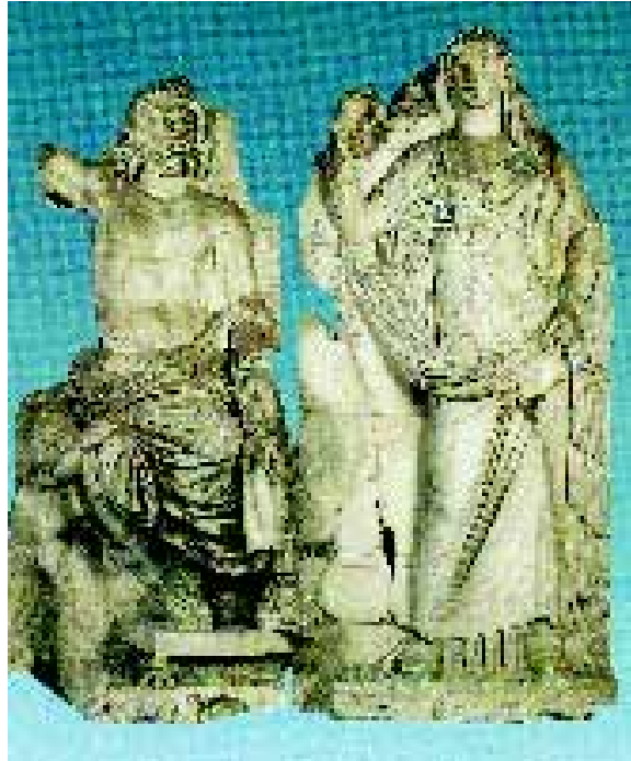
Tanrı Poseidon ile Tanrıça Demeter

1950'den sonra Türkiye'nin yaşadığı büyük dönüşümden İzmir de olumsuz etkilenecek, birbirine eklenen kasabalar şeklinde büyüyerek sağlıklı bir metropol haline dönüşecektir.